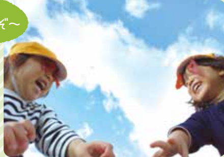
三田市/三田虹の子保育園