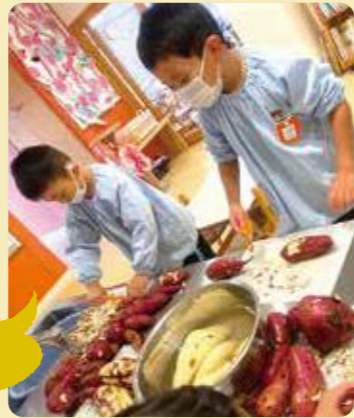
高砂市/みどり丘こども園