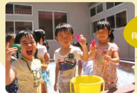
香美町/みなと保育園