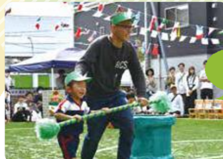
明石市/保育所型認定こども園ステラート保育園