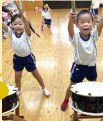
加古川市/認定こども園 ゆき保育園