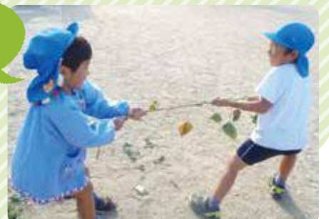
洲本市/中川原保育所