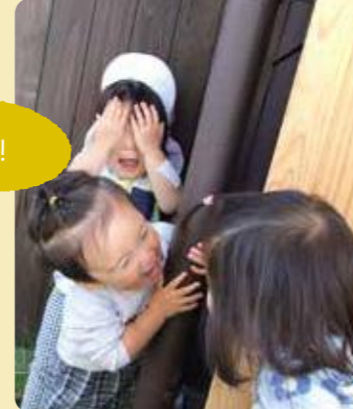
宍粟市/宍粟わかば