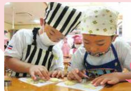
丹波市/認定こども園みつみ