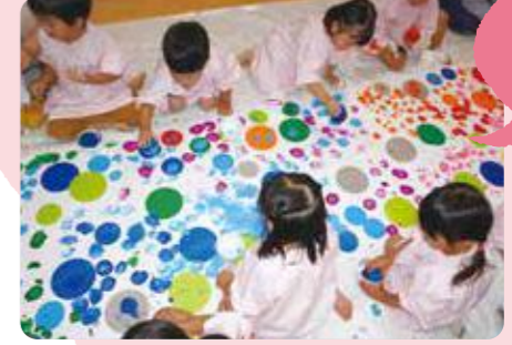
市川町/屋形こども園