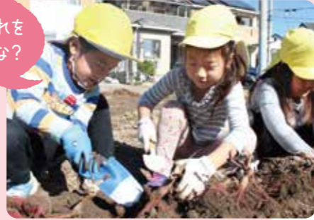
伊丹市/長尾保育所