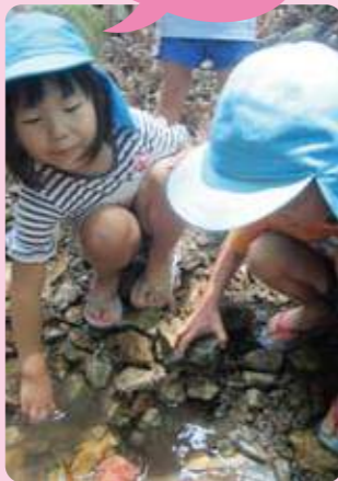
丹波市／ 認定こども園みつみ

丹波市岩屋にある石龕寺(せきがんじ)というお寺に流れている川に、カニがたくさんいると聞き、カニ捕りに出掛けました。「川の水は冷たいな!」と、足を川に踏み入れるやいなや驚く子どもたち。川底の石を持ち上げると、サワガニがちょこちょこ動き出し、子どもたちは歓声を上げながら捕まえようと一生懸命。時間も忘れて川の中を歩き回って遊び、初夏の自然を満喫した一日でした。園に連れて帰ったカニたちは、子どもたちに世話をしてもらいながら今も元気に過ごしています。