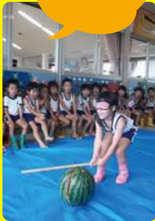
小野市／白百合保育園

5歳児クラス夏の一大イベント”お泊まり保育”。「もうすぐ園に泊まるねんな」「カレー作るんやで」と、とても楽しみな声と「夜一人で寝れるかな」とちょっぴり不安な声も。でも始めてしまえば元気いっぱい、カレー作りやスイカ割り、キャンプファイヤー、スタンツの披露、おぼけやしき、花火などお友達といっぱい遊びました。寝る時も「一緒に寝よか」と、ぐっすり。家族と離れてお友達と一緒に過ごしたたくましい姿を報告すると、保護者も大喜び。成長を感じた一日になりました。